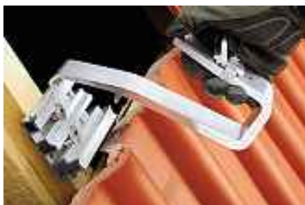
Einfache und schnelle Montage durch Klick-In System.