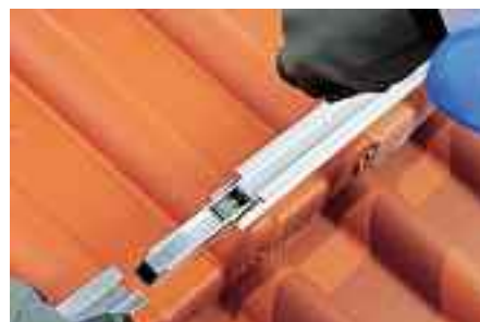
Werkzeuglose Montage des Schienenverbinders ohne Verschraubung.